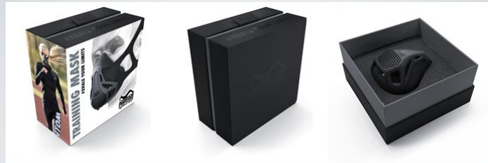
CARTON PACKING WITH CARTON SLEEVE